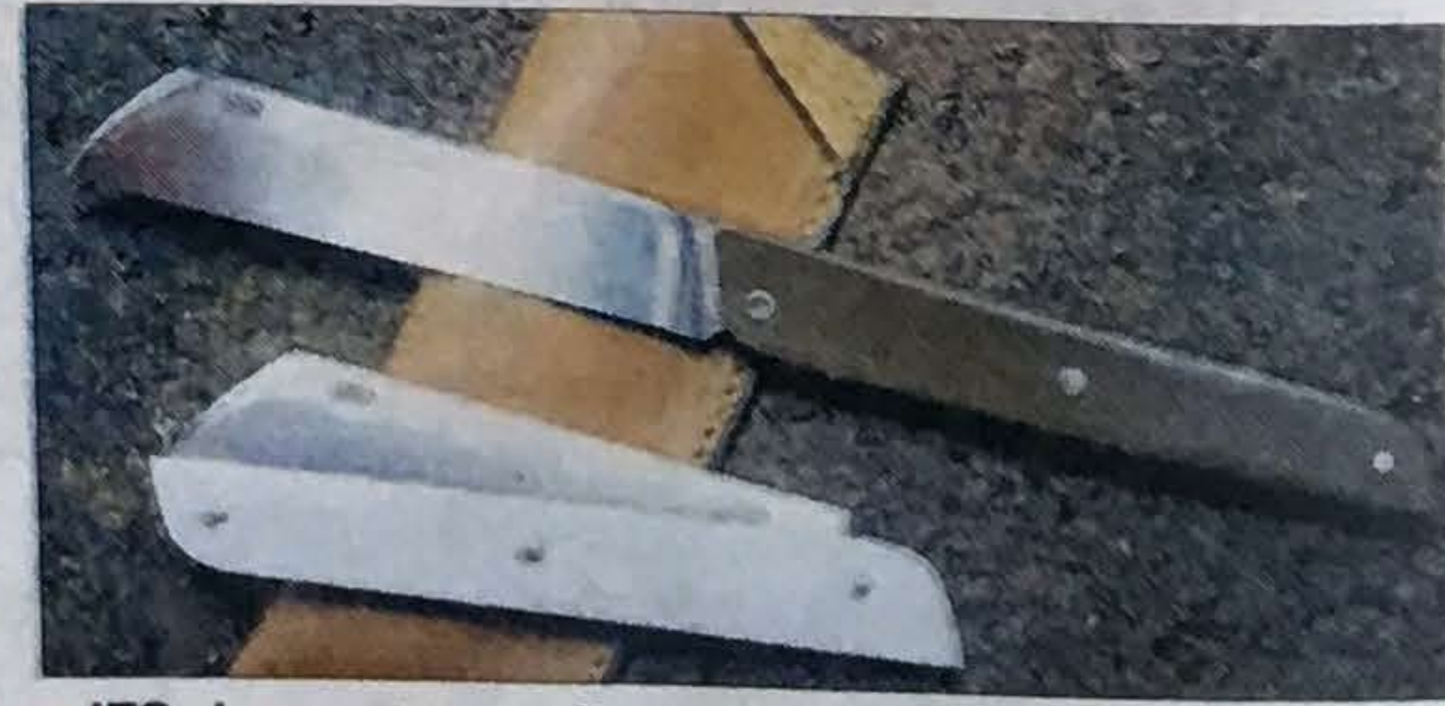
■ ITO, le couteau pliant de poche signé Samuel Guichard.