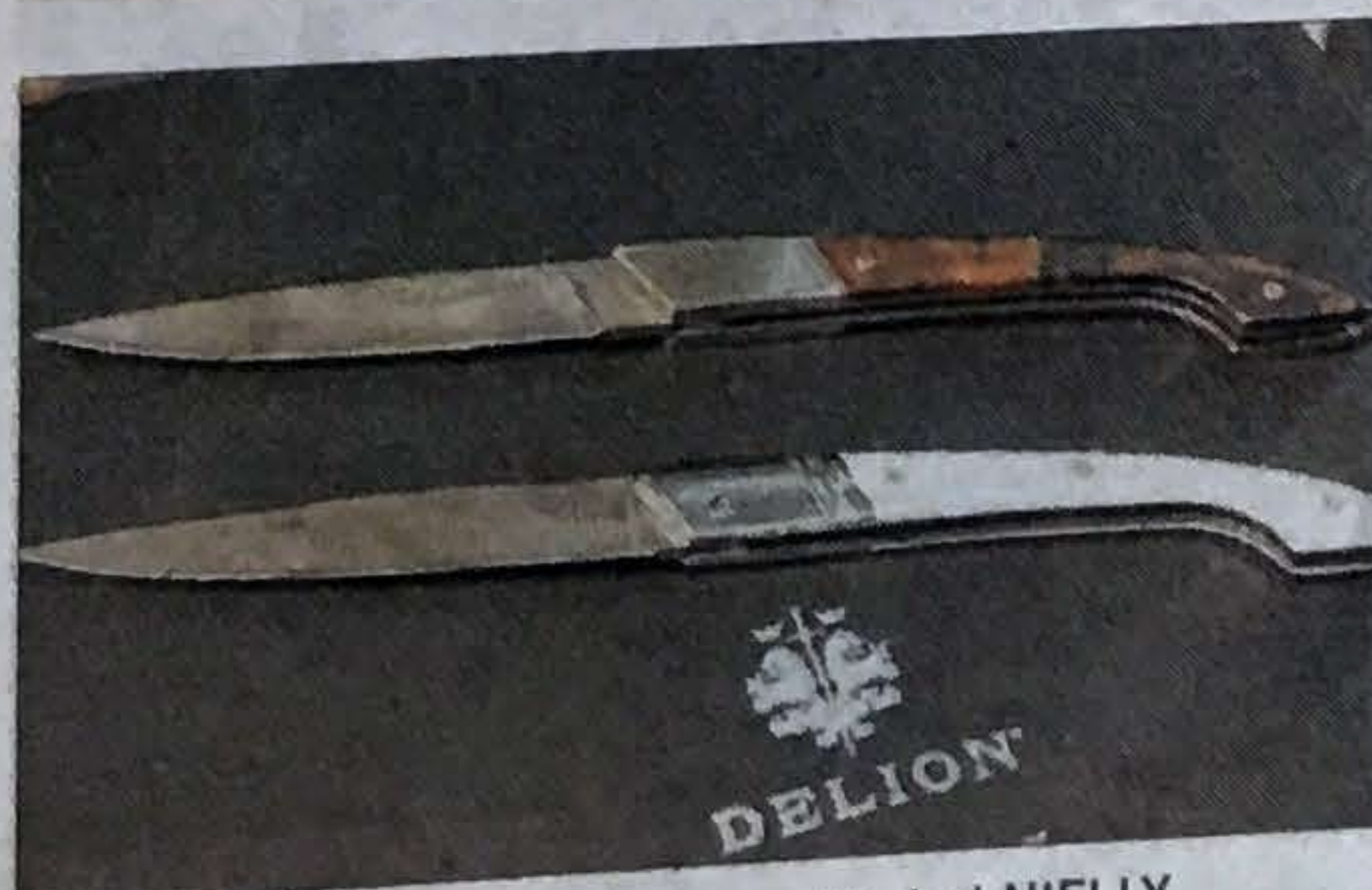
■ « Le Lyonnais ».