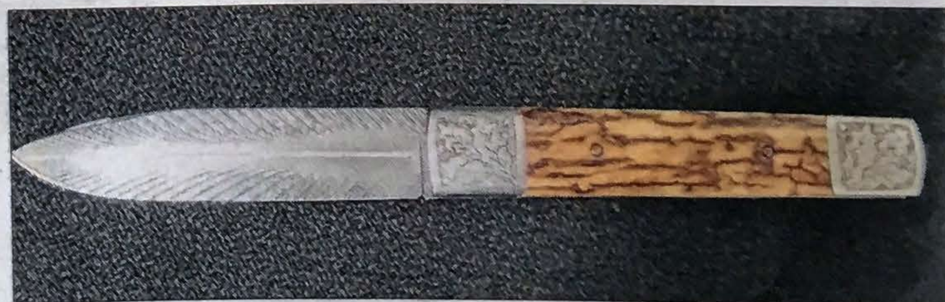
■ Eric Depeyre propose Le Gône , modèle haut de gamme gravé de feuilles de chêne avec lame en Damas de plumes d'oiseau.

Marie-Christine Parra mariechristine.parra@leprogres.fr